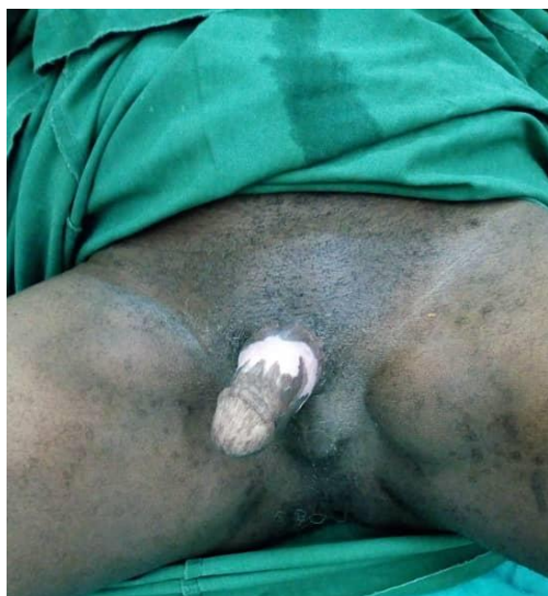
Figure 5: Aspect au 3ème mois d'une reconstruction périnéale par enfouissement