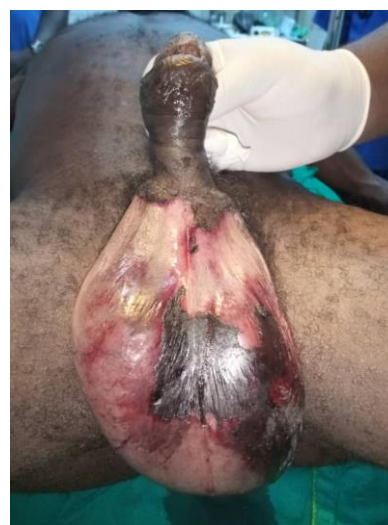
Figure 3: Gangrène de Fournier