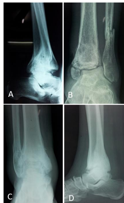
Figure 5: complications chroniques des Fracture-luxations de cheville. A. Cal vicieux avec subluxation résiduelle et arthrose talo-crurale. B. Pseudarthrose bimalléolaire. C et D. Arthrose talo-crurale grade III (sévère)

chirurgical. Seuls 50% des patients avaient une réduction anatomique de leurs fractures et 65,3% une cheville parfaitement recentrée. Des complications tardives ont été retrouvées chez 73% des patients, dont la principale était l'arthrose talo-crurale post-traumatique.