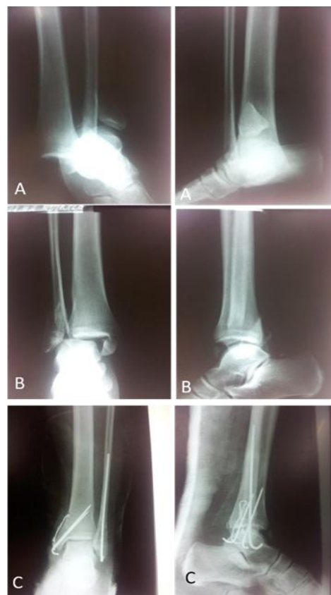
Figure 4: Prise en charge d'une fracture-luxation de cheville. A. à l'admission, B. après réduction immédiate aux urgences, C. résultat après ostéosynthèse par haubanage malléole médiale + embrochage malléole latérale

Concernant spécifiquement le traitement initial des FLC ouvertes, un parage chirurgical a été réalisé dans tous les cas. Il était associé à une fixation externe dans 4 (25%) cas, une ostéosynthèse interne dans 7 (43,8%) cas, un clou trans-plantaire dans 2 (12,5%) cas et un plâtre fenêtré dans 3 (18,7%) cas. Les patients étaient encouragés à démarrer une rééducation fonctionnelle précoce, ce qui a été le cas pour 63,3 % des patients.