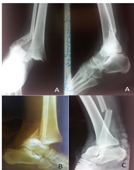
Figure 3: Radiographies des Fracture-luxations de cheville. A. forme latérale, B. forme postérieure, C. forme antérieure