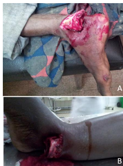
Figure 1: Fracture-luxations ouvertes de cheville : Présentation clinique à l'admission aux urgences

L'ouverture cutanée (figure 1) était retrouvée dans 16 (30,8%) cas, dont 6 (37,5%) de type I, 8 (50%) de type II et 2 (12,5%) de type III.