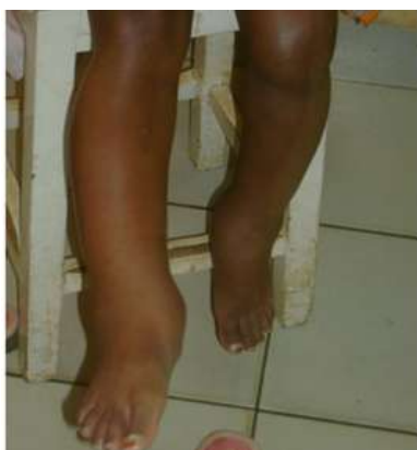
FIGURE 1. ŒDÈME ASYMÉTRIQUE DES MEMBRES INFÉRIEURS

Elle a été marquée par une régression importante et transitoire des œdèmes puis, il y a eu recrudescence de ces derniers au bout de la deuxième semaine, avec un gain pondéral progressif. Un examen minutieux a permis de constater que ces œdèmes étaient élastiques, asymétriques, plus douloureux qu'auparavant (figure 1). Le cordon veineux n'avait pas été perçu à la palpation des mollets. Le diagnostic d'une thrombose veineuse des membres inférieurs a alors été évoqué. La cotation selon le score de Wells permettait de la classer dans le groupe de probabilité moyenne.